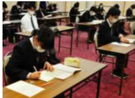
↑ 勉強するには慣れない環境です