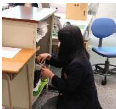
↑ メモリを見つけた瞬間