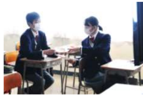
↑ 意見交換をする1年生①