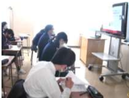
↑ 各自で考える1年生