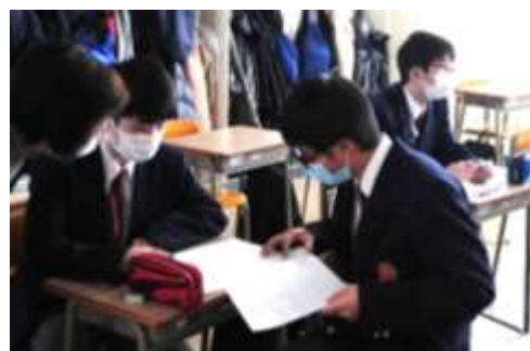
↑ 意見交換をする1年生②