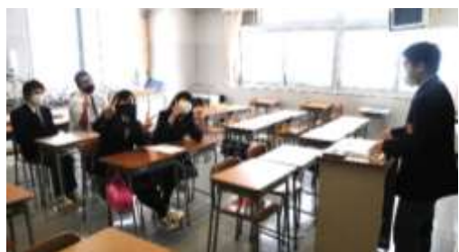
↑ 会場移動しクイズに答える

2月4日(木)、本校体育館と校舎を使用して3年生を送る会が行われました。運営を行ったのは令和3年度の生徒会農業クラブの執行部です。最初に、体育館で3年生を三つのグループに分けました。その後、執行部から出題された第一の暗号を解き、特別教室へ移動しました。移動先の一つ目の特別教室では執行部が考えた留寿都高校に関する10個の問題に3年生が答えました。3年生が10の問題に答えた後、第二の暗号を解き、別の特別教室へ移動しました。移動先の一つ目の特別教室ではUSBメモリを探しました。USBメモリを探し出した3年生が体育館に戻ってきました。この間の3年生の様子をChromebookを使って中継し、在校生が体育館で見っていました。その後、体育館で各学年からのメッセージの動画を順番に見ていきました。最後に、3年生から一人一言を在校生に向けてスピーチしました。会が終わった後、3年生は教室でクラスの皆で振り返って様々な話をしていました。