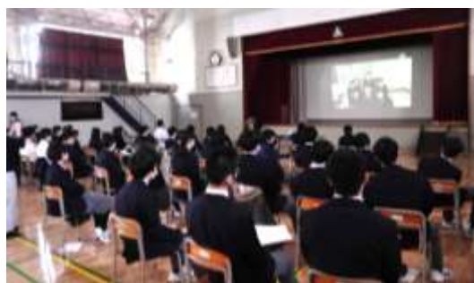
↑ ビデオメッセージを見る生徒