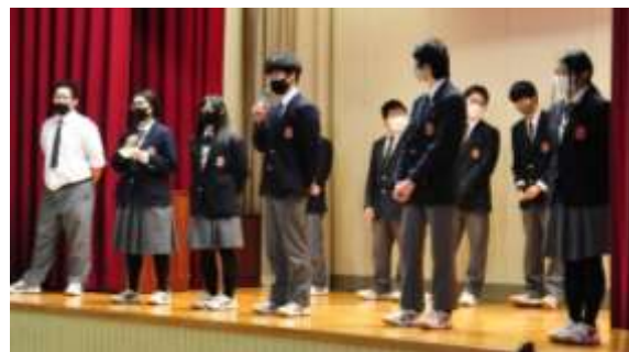
↑ 3年生全員から一人一言