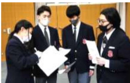
↑ 留高や担任の先生に関する難題が続出