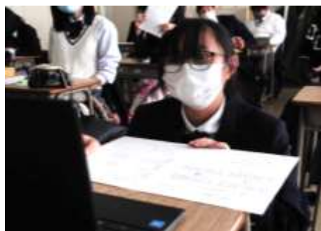
↑ 代表で発表をする2年生